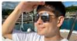
林志穎車禍後 首發聲 媒體造謠 揭榜揭光