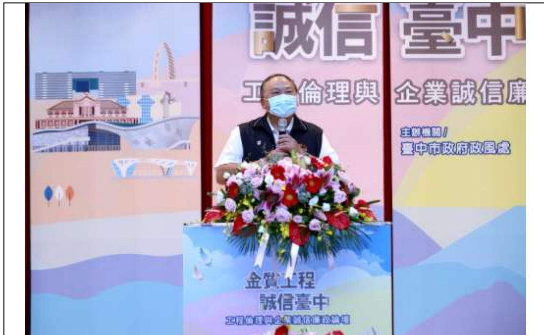
圖1：臺中市陳副市長子敬開幕致詞