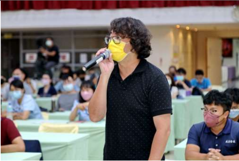
圖11：座談會 與會廠商及同仁提問