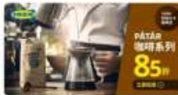
「限時85折」IKEA咖啡豆、粉系列