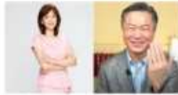
64席名師論壇 預計年底登記 演講對象是主講