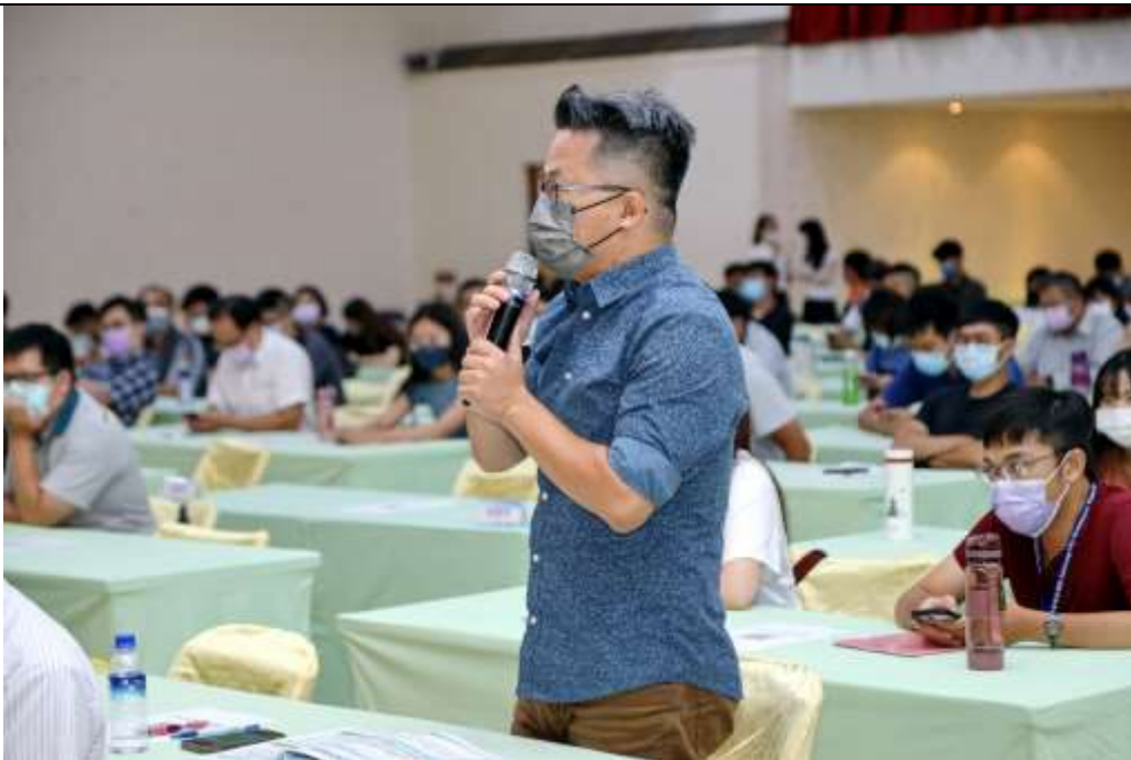
圖12：座談會 與會廠商及同仁提問