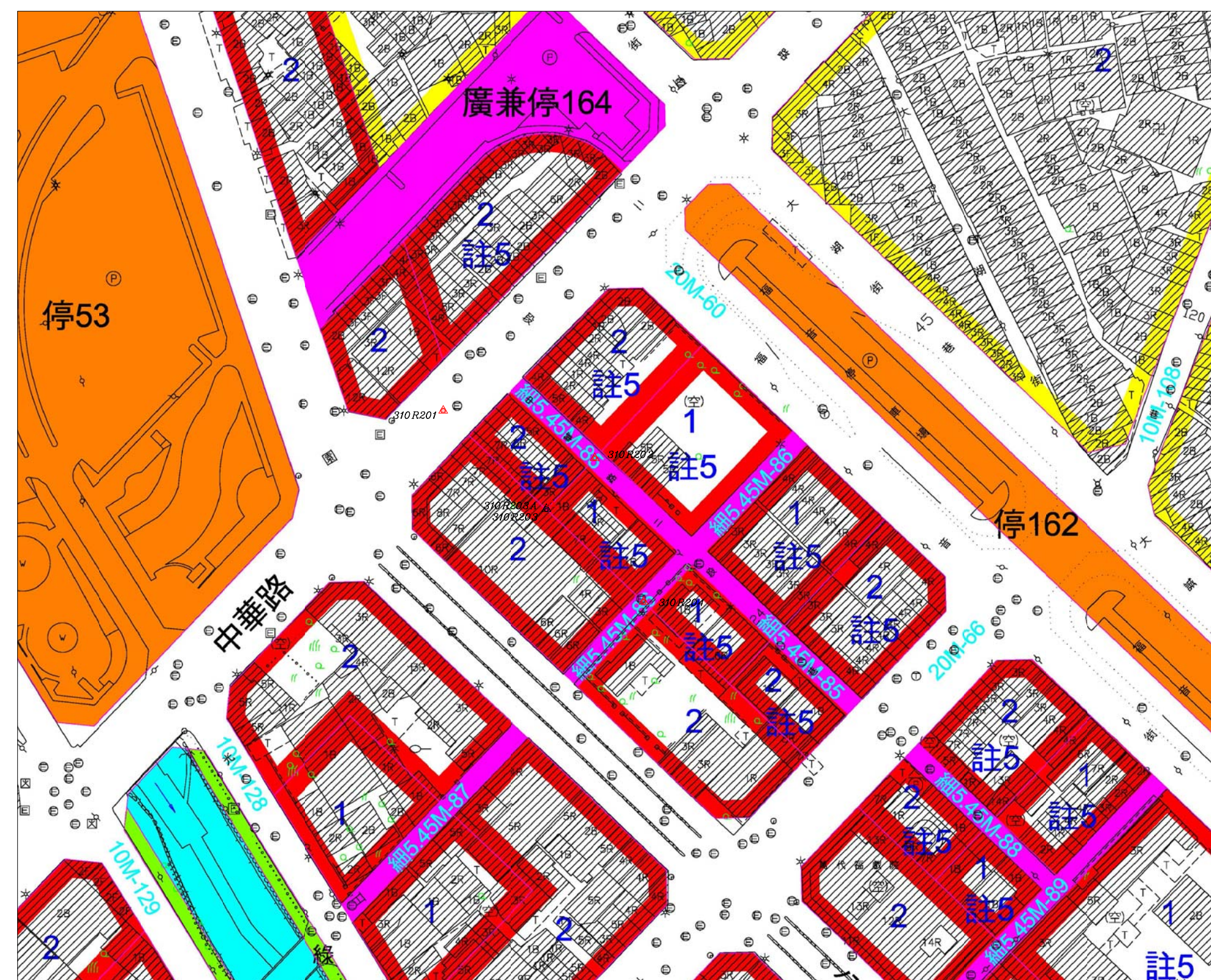
都市計畫樁位公告圖 SCALE=1/1000