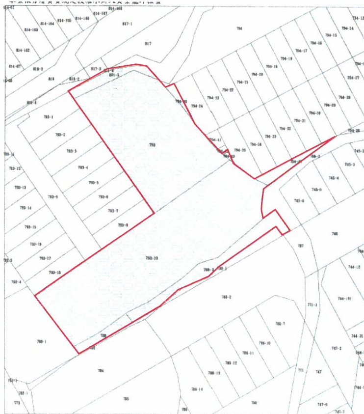
更新單元地籍示意圖