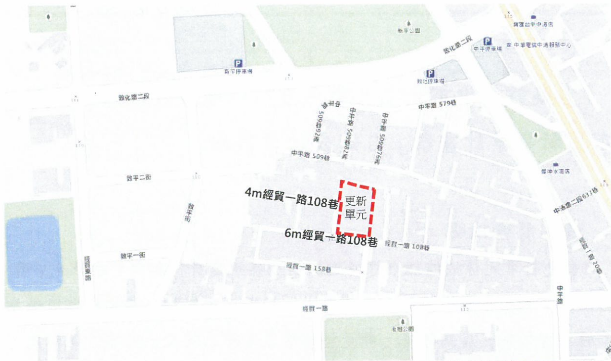
更新單元位置示意圖