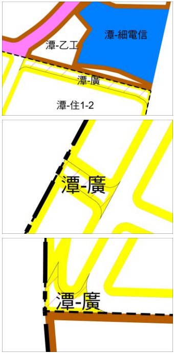
變3案 變更內容示意圖