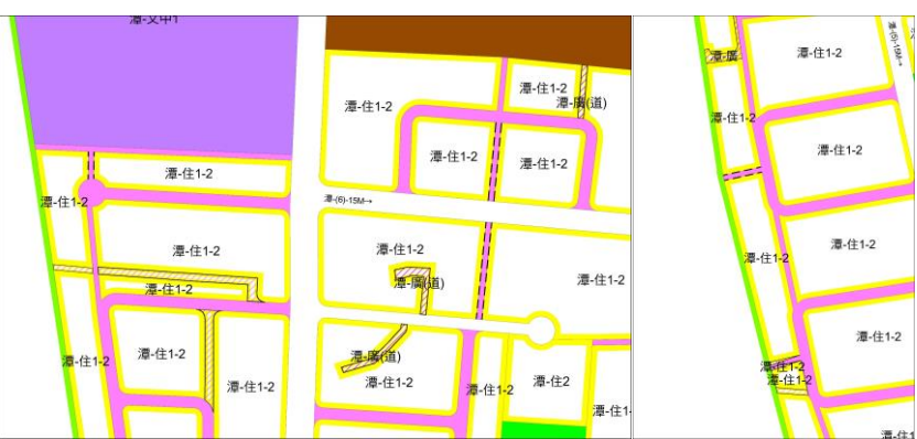
變2案 變更內容示意圖(1)

附註： 1.凡本次計畫未指明變更部分，皆應以原有計畫為準。 2.圖面註明「附帶條件」部分詳見計畫書內附帶條件內容。