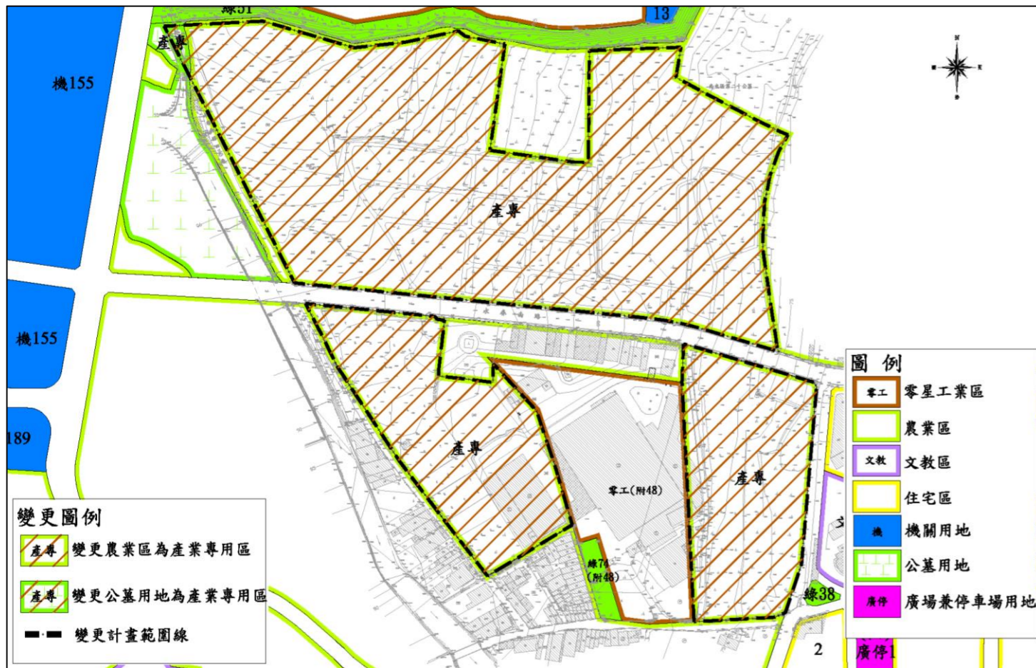
變更計畫內容示意圖