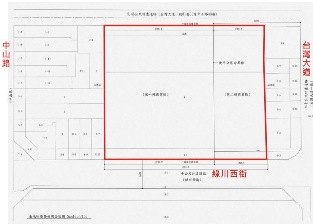
圖二、申請變更範圍圖