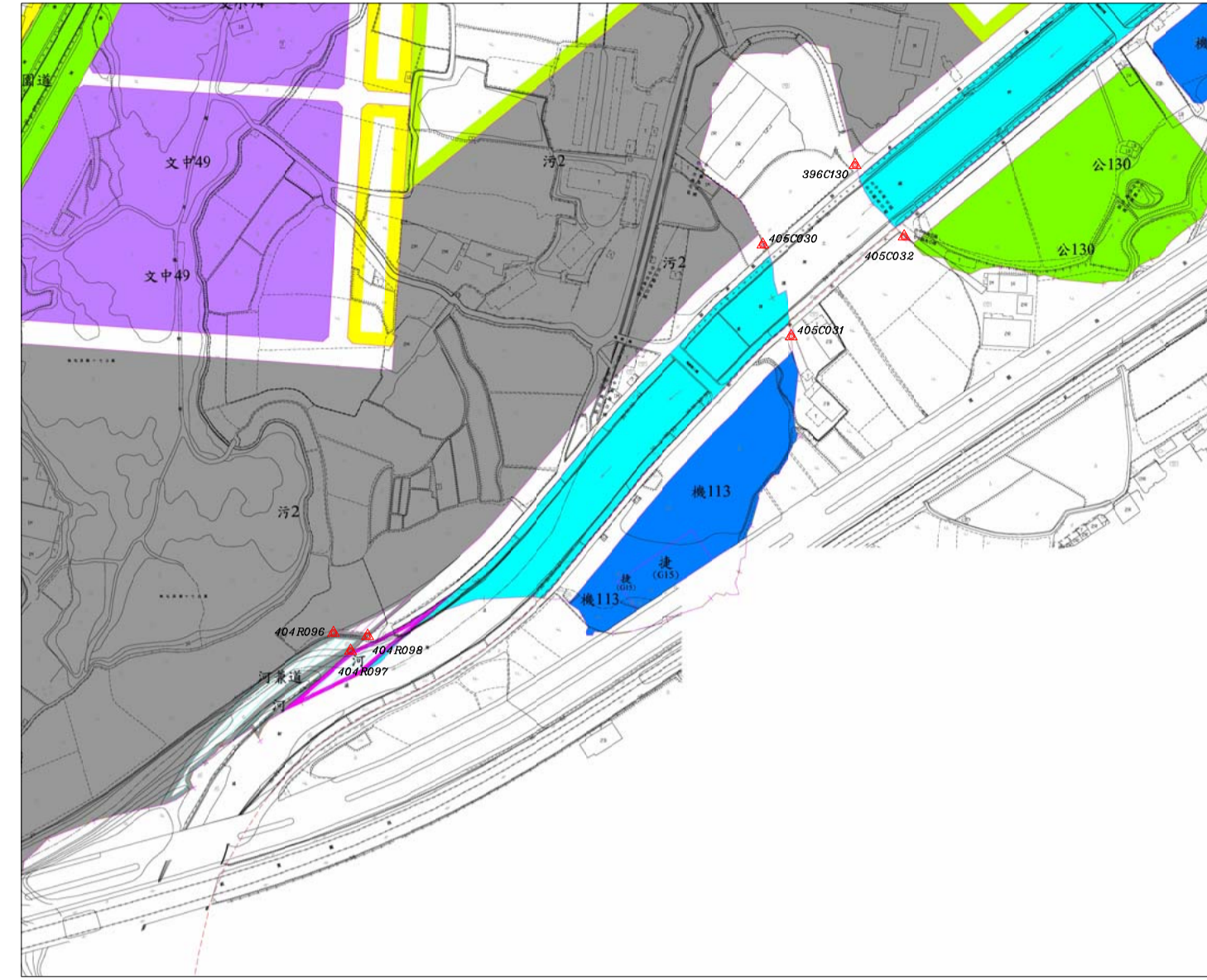
都市計畫樁位公告圖 SCALE=1/3000