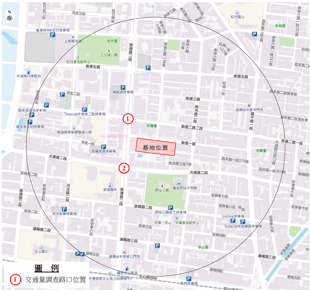
圖 1-1 基地與調查路口位置示意圖

本基地位於臺中市北屯區平田段 984、985、985-1、985-2、985-3、986-10 地號等 6 筆土地，基地北側單面臨崇德一路，基地位置及基地周邊交通路網，詳圖 1-1 所示。