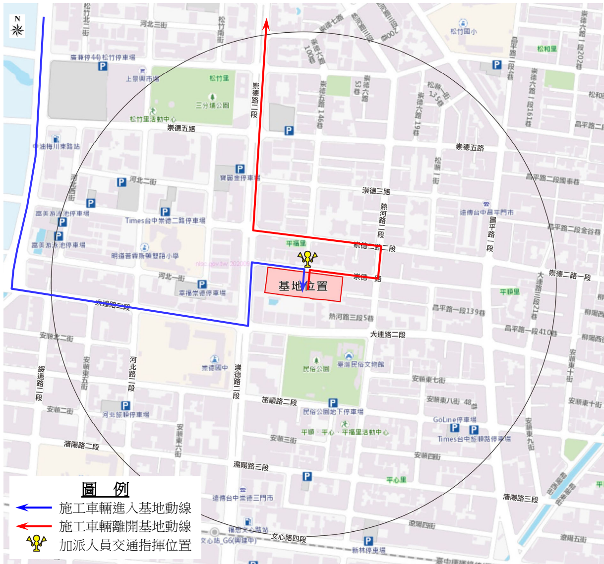
圖 3-1 施工階段運輸動線示意圖