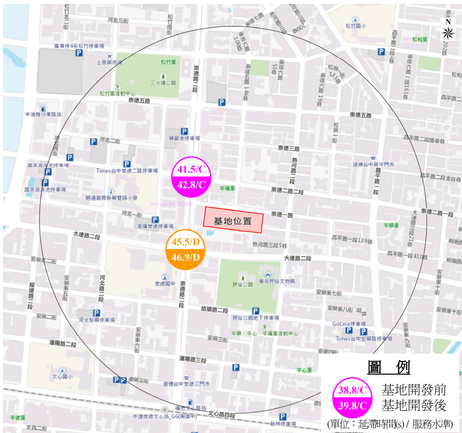
圖 2-2 基地開發前後服務水準比較圖 (昏峰)