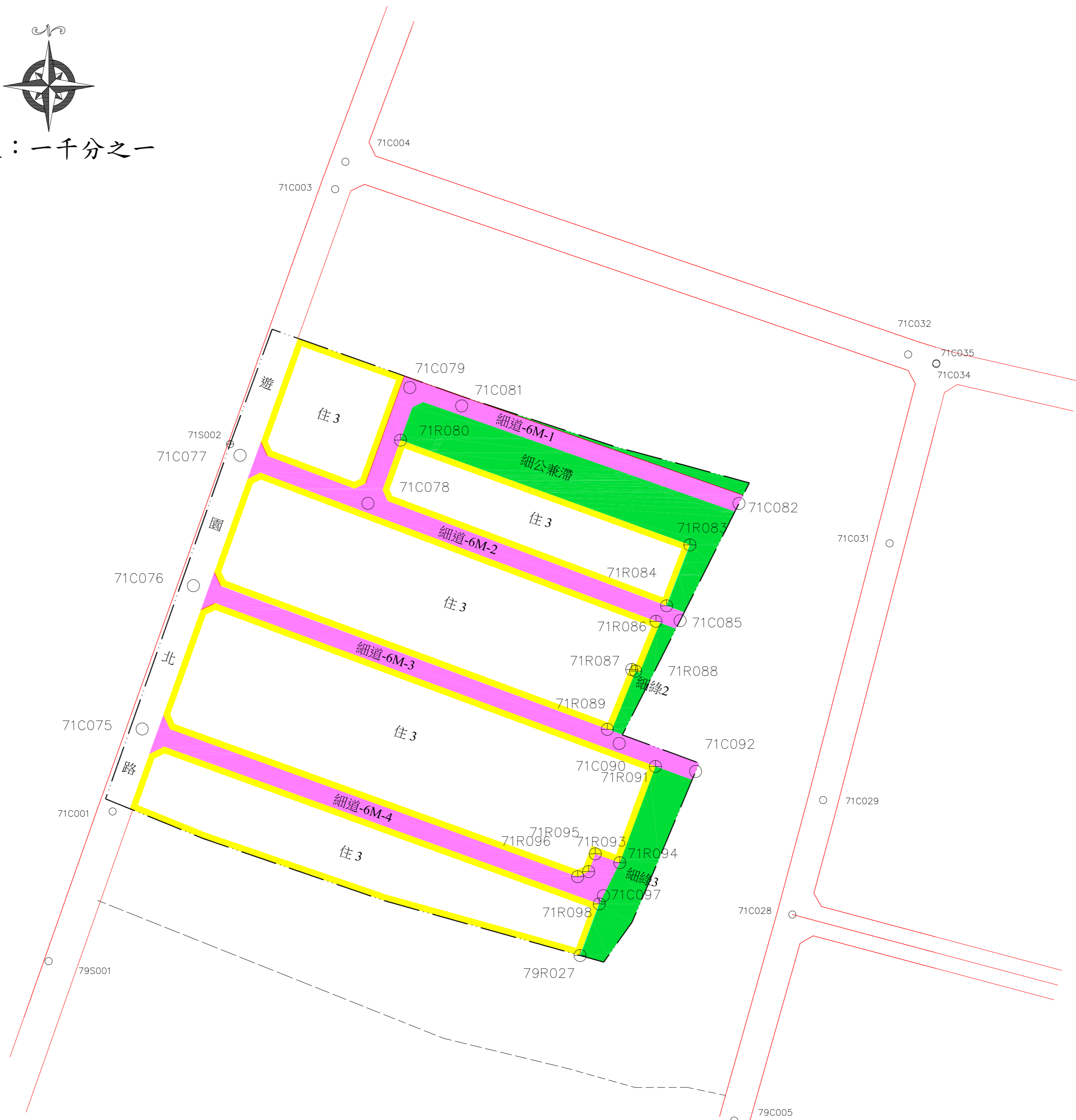
都市計畫樁位公告圖 SCALE=1/1000