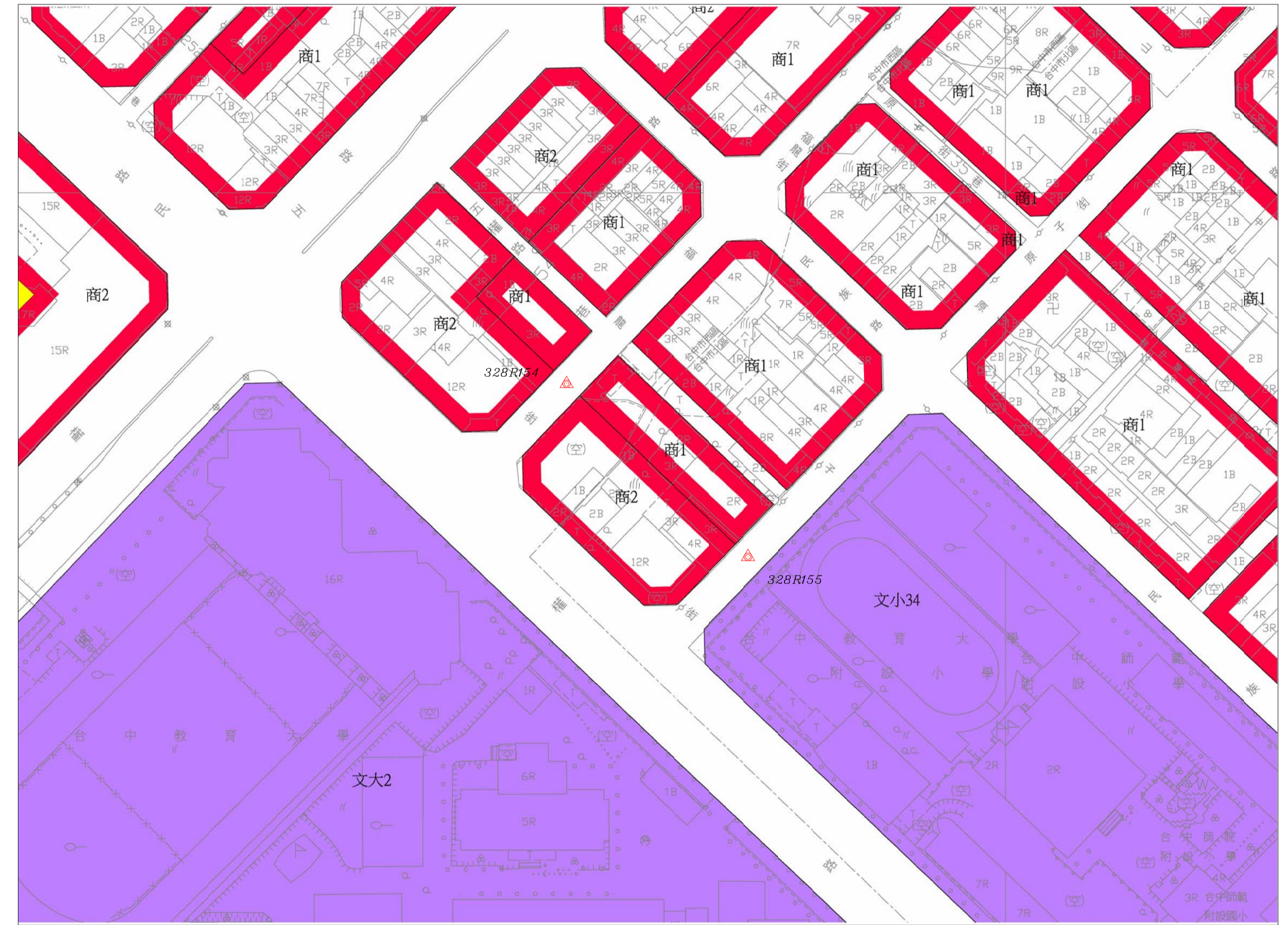
都市計畫樁位公告圖 SCALE=1/1000