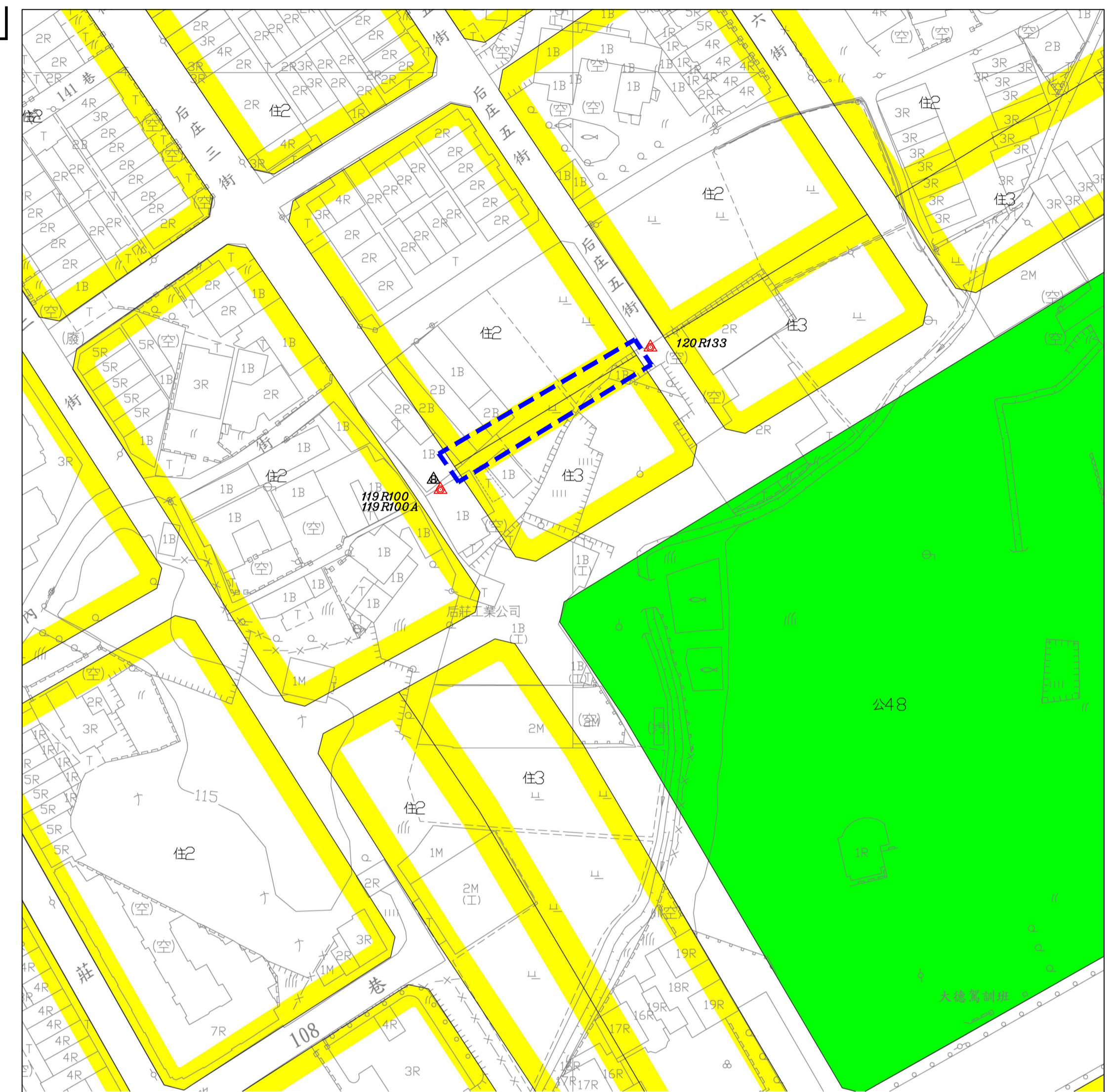
都市計畫樁位公告圖 SCALE=1/1000