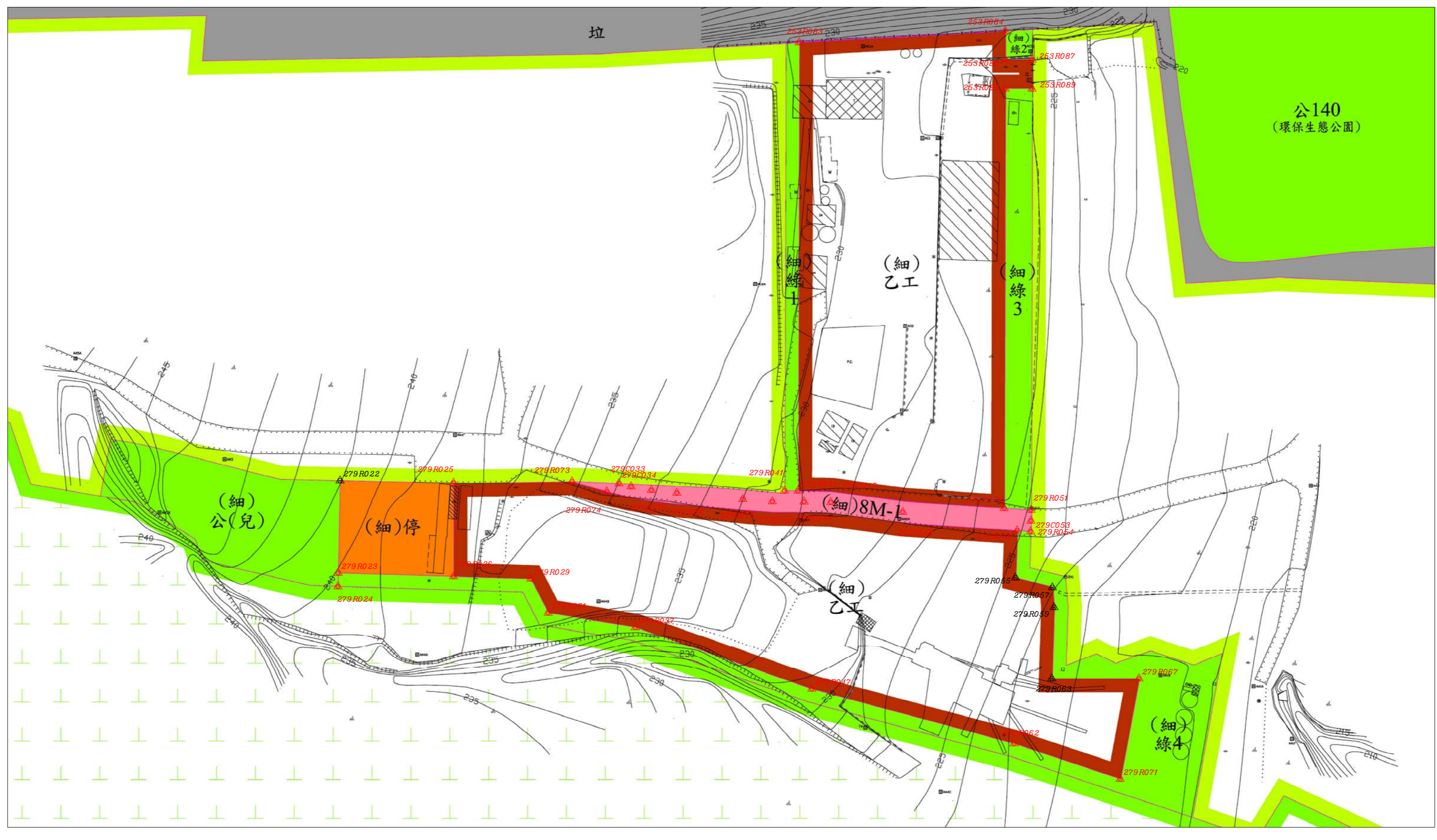
都市計畫樁位公告圖 SCALE=1/1000