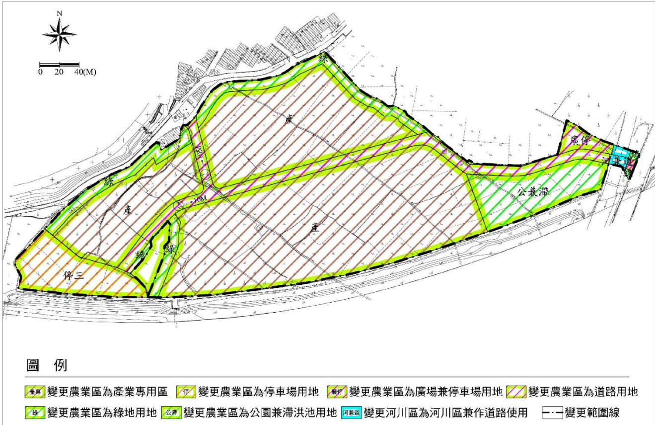
圖 1 變更主要計畫示意圖