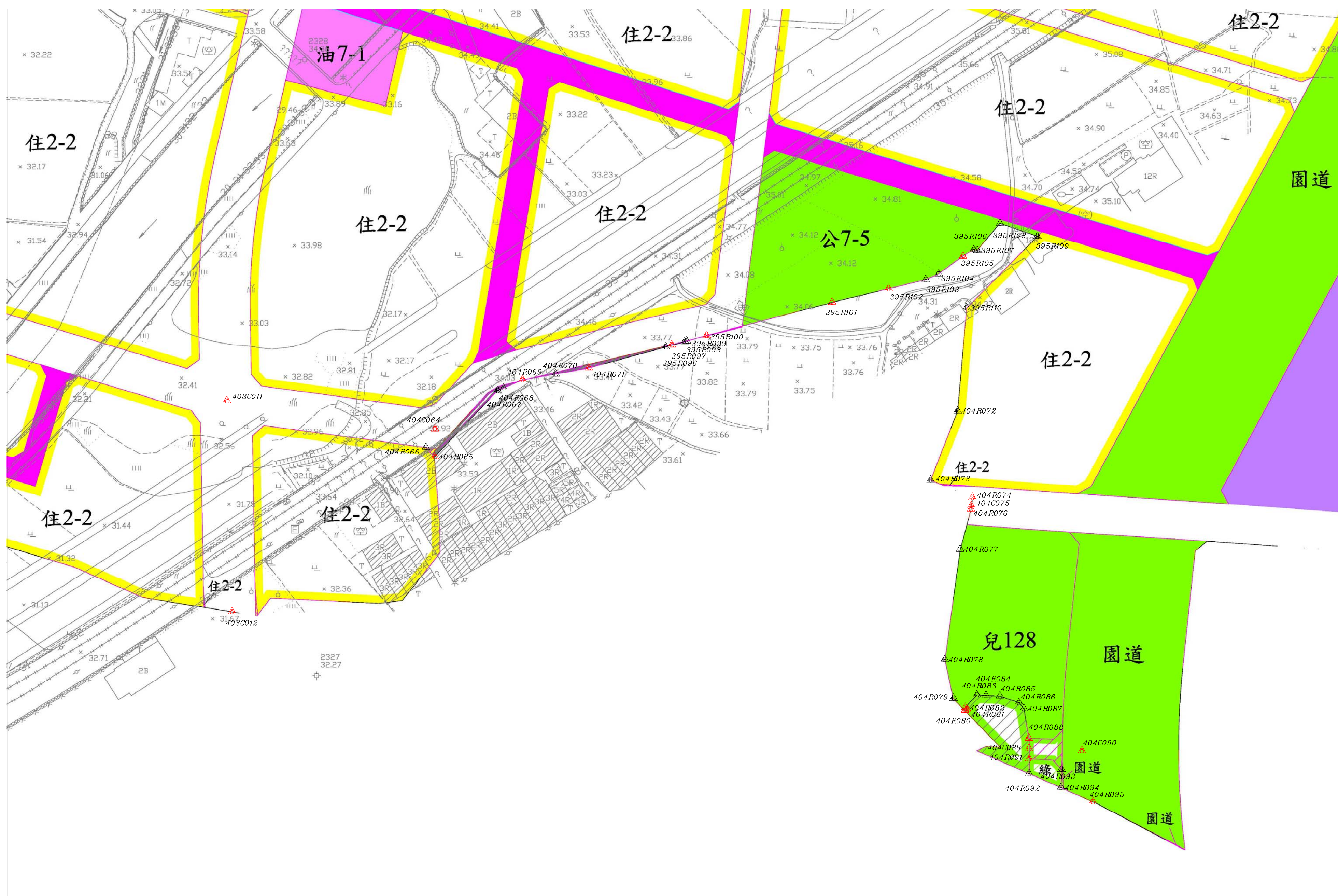
都市計畫樁位公告圖 SCALE=1/1000