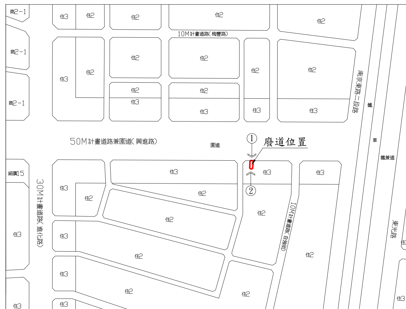
位置圖 SCALE = 1:3000