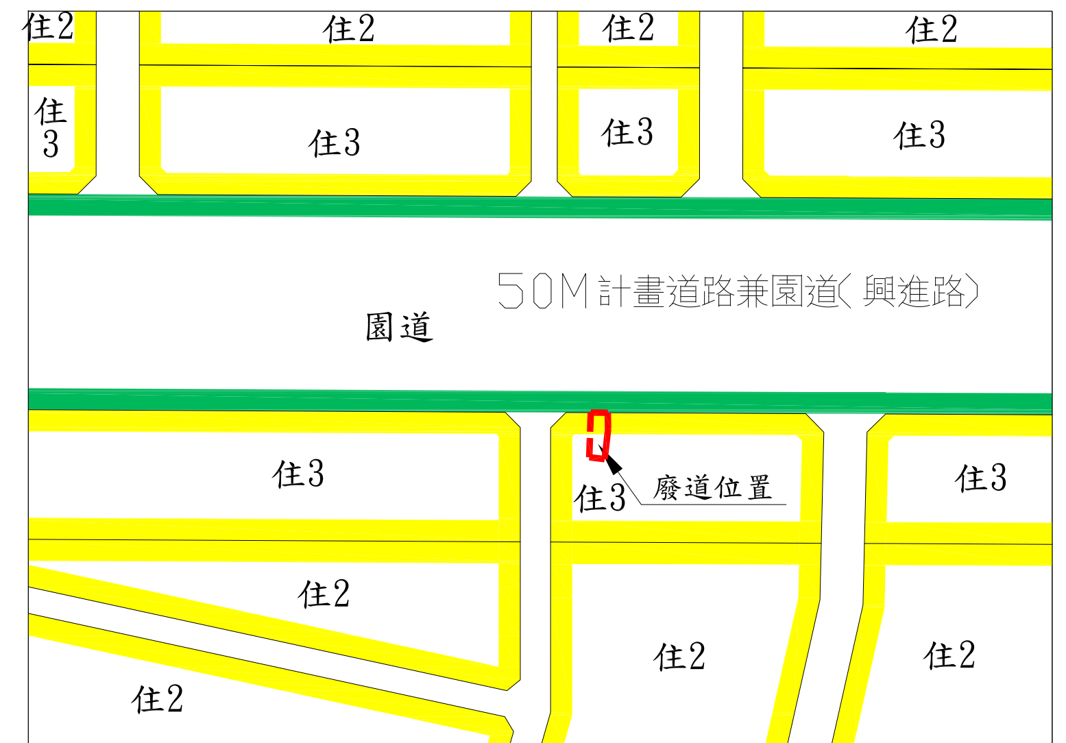
都市計畫圖 SCALE = 1:1200