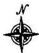
公告圖文圖說平面圖 Scale=1/300