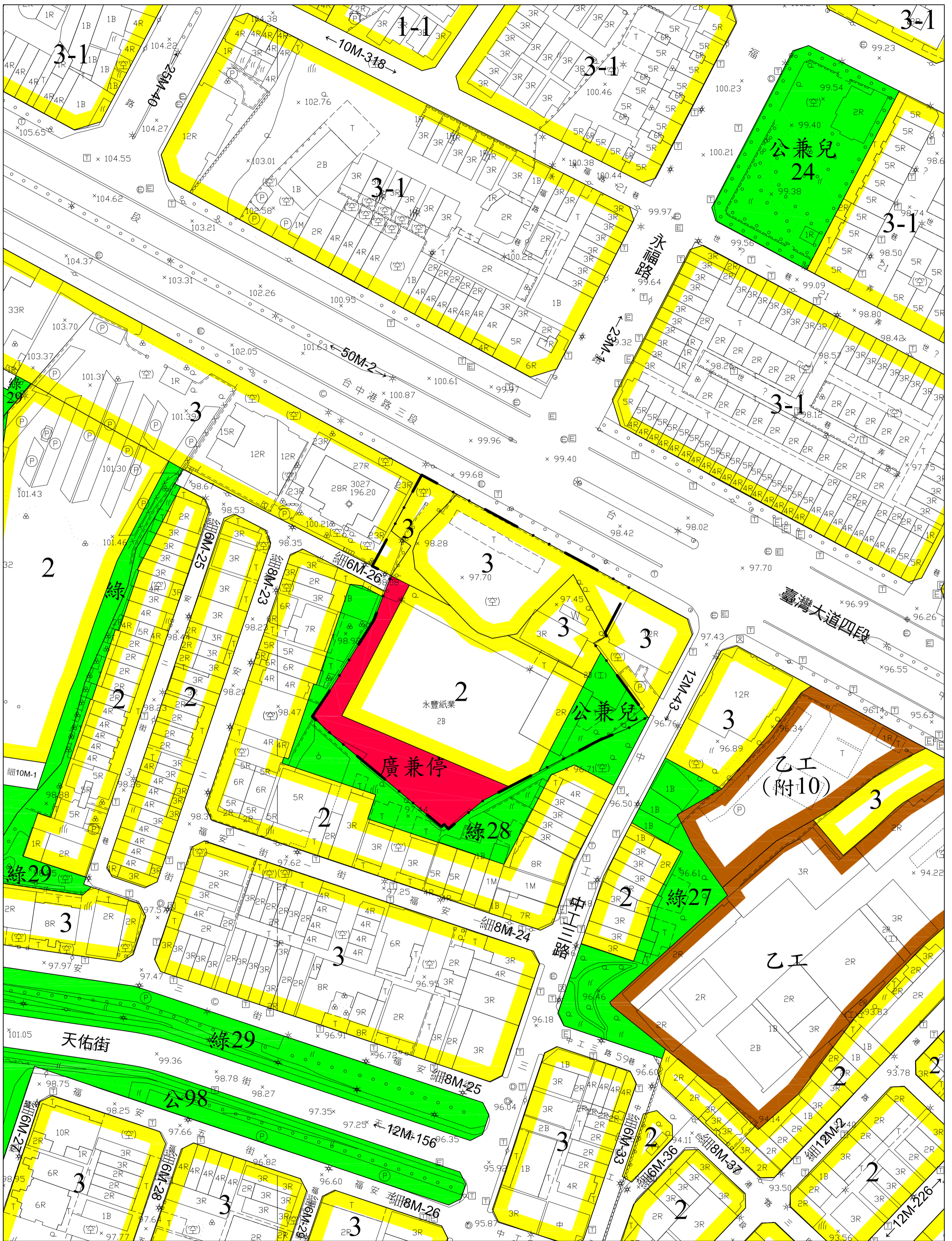
計 畫 圖 例