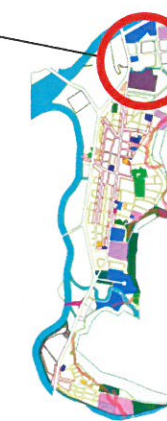
圖一 變更範圍及位置示意圖