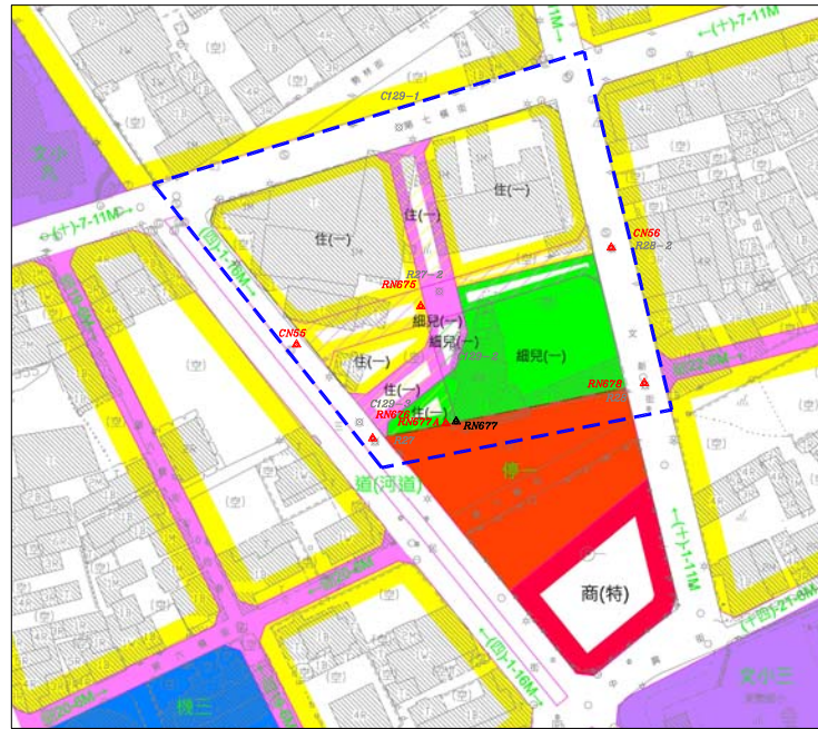
都市計畫樁位公告圖 SCALE=1/1000