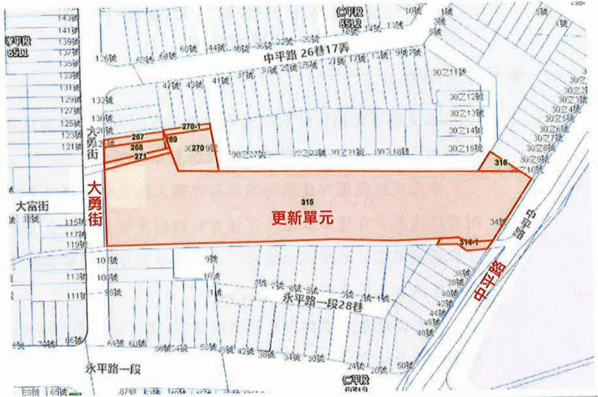
更新單元位置示意圖