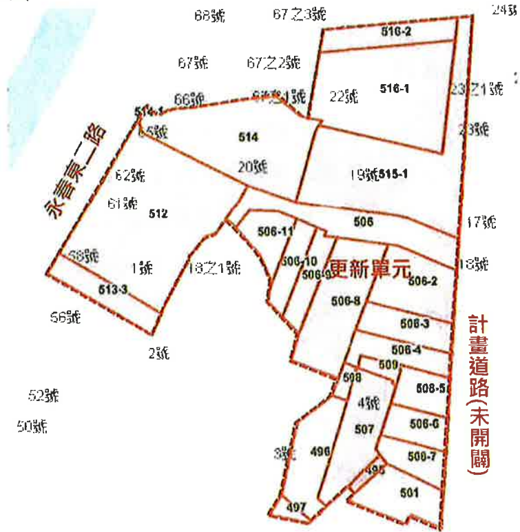
更新單元範圍示意圖