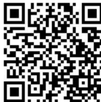
本府都市發展局網站 QRcode