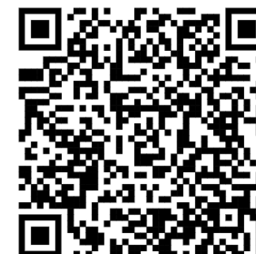
本府都市發展局網站QRcode

本計畫依循「海岸管理法」第25條及「一級海岸保護區以外特定區位利用管理辦法」第6條等規定辦理，以期達到發展綠能並兼顧維繫自然系統、防治海岸災害與環境破壞，促進海岸地區永續發展等之目的。