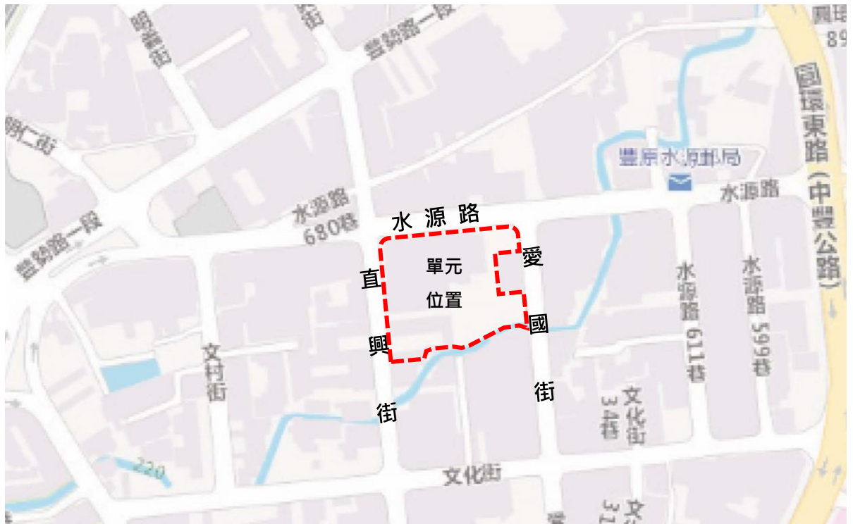
更新單元位置示意圖