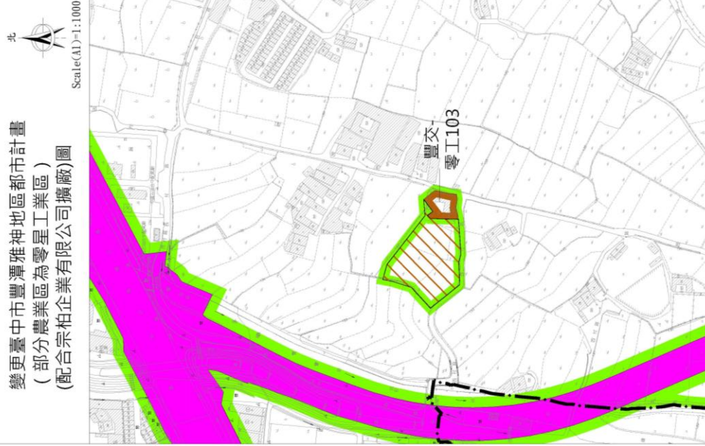
圖1 變更臺中市豐潭雅神地區都市計畫(部分農業區為零星工業區)案變更位置示意圖 (配合宗柏企業有限公司擴廠)