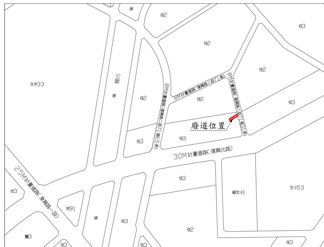
位置圖 SCALE = 1:3000