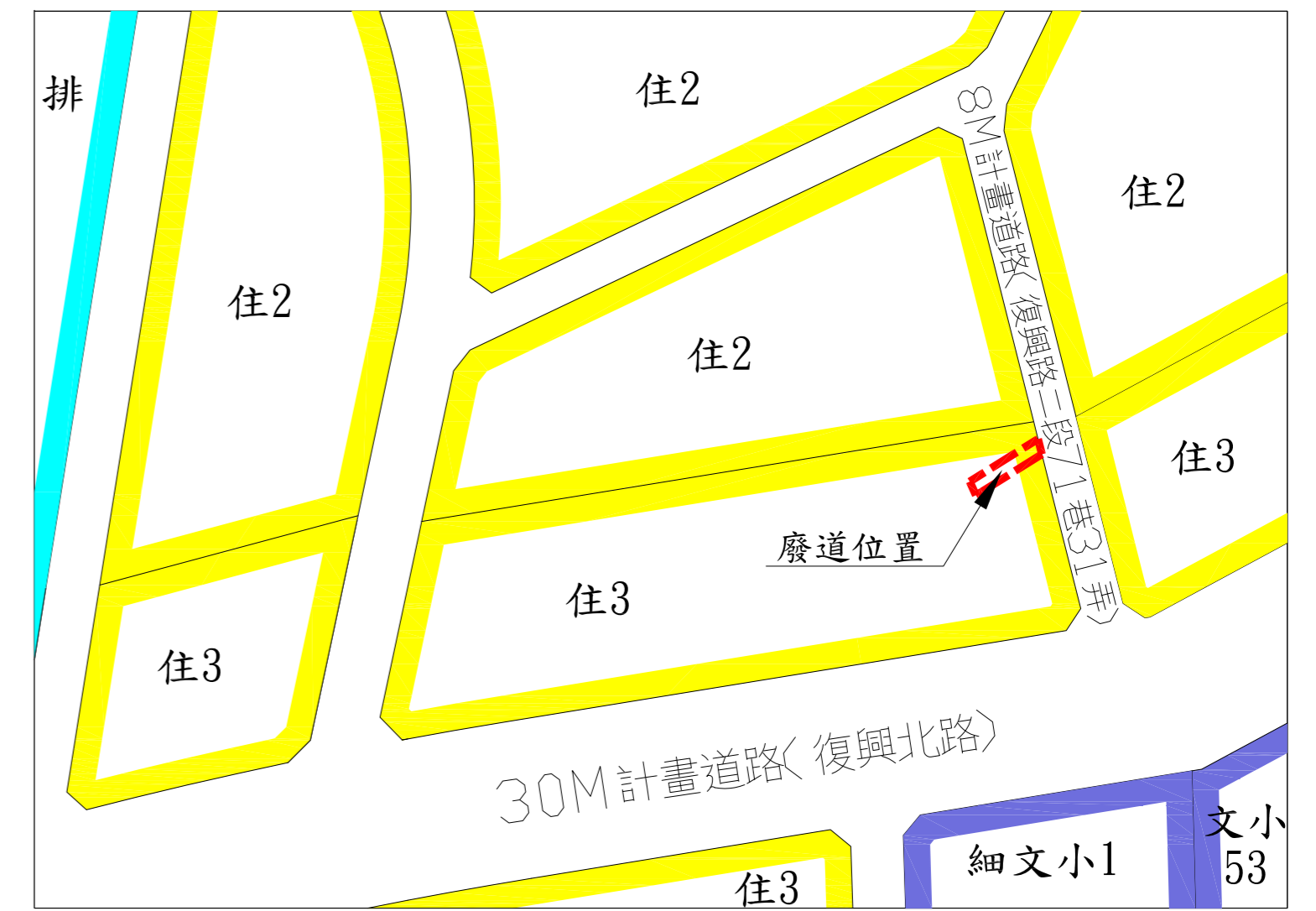
都市計畫圖 SCALE = 1:1200